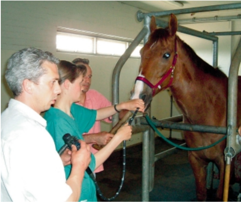
Met een laryngoscopie kan de dierenarts het keelgebied bekijken.

Cornage is een verlamming van de stemband, meestal de linker, waardoor de luchtdoorgang door de keel via het strottenhoofd (larynx) richting luchtpijp en longen vernauwd raakt. Rijpaarden die cornage hebben, hebben daar niet altijd echt last van. Er zijn behoorlijk wat dressuur- en springpaarden met cornage die uitstekend kunnen presteren. Het bijgeluid is wel vervelend, maar zeker niet altijd een maat voor benauwdheid. Anders ligt het bij de draf- en rensport. Een volbloed of een draver met een vernauwde toegang richting longen kan iets minder zuurstof opnemen en zal ten opzichte van een gezond paard steeds een paar meter moeten toegeven. De verlamming van de stemband ontstaat door verval van de zenuw die de spier aanstuurt die de stempleet opent. In 95 procent van de gevallen betreft het een zenuwaandoening met een erfelijke achtergrond. Het KWPN, het grootste stamboek in Nederland, screent daarom al jaren op cornage. Alleen na een