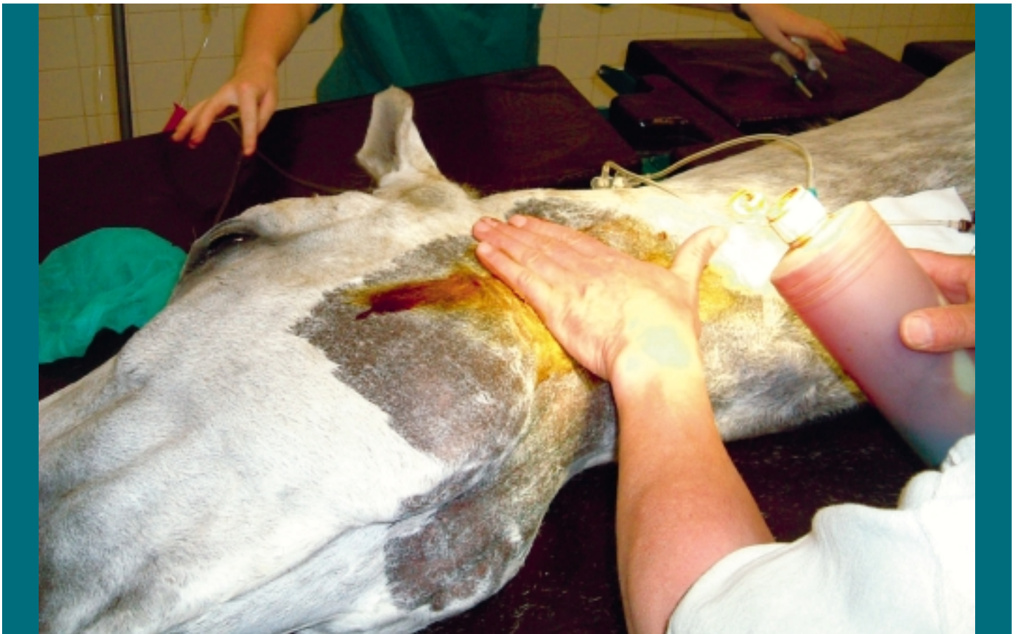
Bij een cornageoperatie benadert de dierenarts eerst de op te spannen stemband vanaf de zijkant van het strottenhoofd.

Cornage is een verlamming van de stemband, meestal de linker, waardoor de luchtdoorgang door de keel via het strottenhoofd (larynx) richting luchtpijp en longen vernauwd raakt. Rijpaarden die cornage hebben, hebben daar niet altijd echt last van. Er zijn behoorlijk wat dressuur- en springpaarden met cornage die uitstekend kunnen presteren. Het bijgeluid is wel vervelend, maar zeker niet altijd een maat voor benauwdheid. Anders ligt het bij de draf- en rensport. Een volbloed of een draver met een vernauwde toegang richting longen kan iets minder zuurstof opnemen en zal ten opzichte van een gezond paard steeds een paar meter moeten toegeven. De verlamming van de stemband ontstaat door verval van de zenuw die de spier aanstuurt die de stempleet opent. In 95 procent van de gevallen betreft het een zenuwaandoening met een erfelijke achtergrond. Het KWPN, het grootste stamboek in Nederland, screent daarom al jaren op cornage. Alleen na een