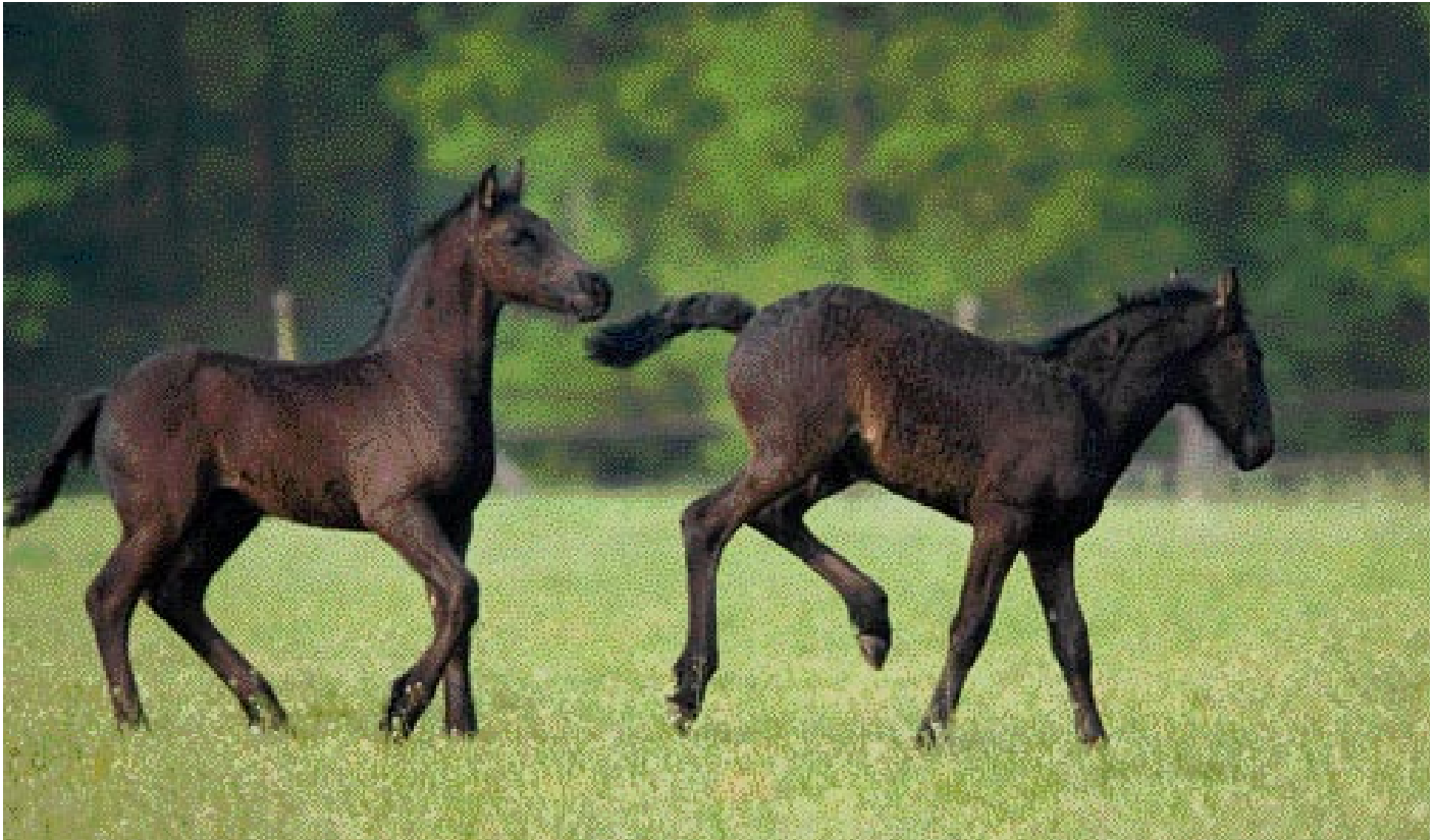
Veulens die samengebracht zijn hebben afleiding en kunnen elkaar 'opvoeden'.

een uierontsteking te voorkomen is het verder raadzaam om de merrie voldoende beweging te geven (na het spenen buiten in de weide!).