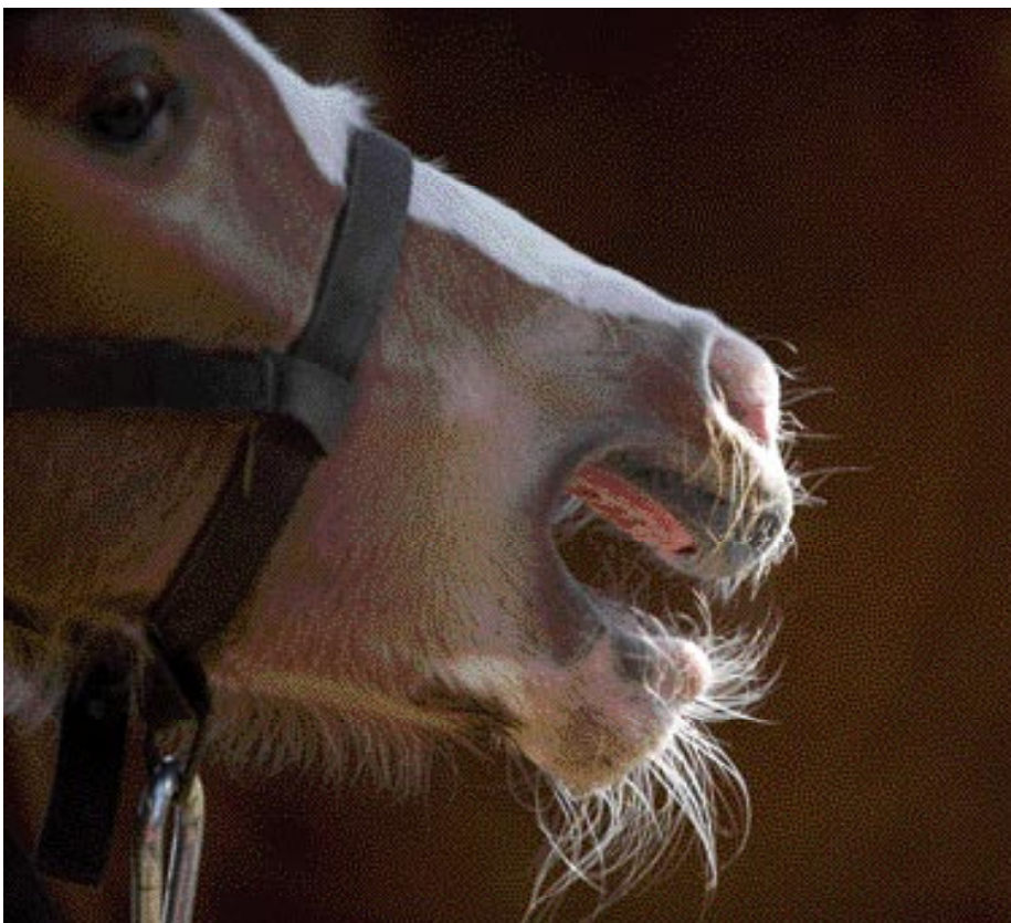
Hartverscheurend: een veulen dat net gespeend is roept uren achtereen om zijn moeder.

nooit apart van de merrie is geweest kan het veulen in paniek raken en hevig gaan roepen en lopen. Vaak is het dan ook het beste om het veulen ver van de merrie te houden zodat er geen contact is tussen de merrie en het veulen. Zowel merrie als veulen zal zich dan vrij snel aanpassen aan de nieuwe situatie. Indien mogelijk is het voor het veulen prettig om met enkele andere veulens