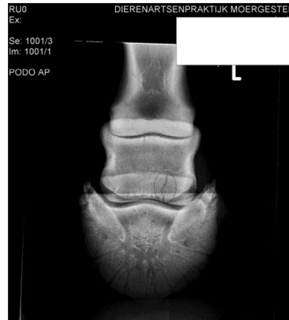
Een straalbeenfractuur ontstaat meestal door met een klap ongelukkig neerkomen op een steen en geeft acuut een ernstige kreupelheid ('op 3 benen').

Een derde oorzaak is een botbreuk (fractuur) of scheur (fissuur) van een van de botten in de ondervoet. Gelukkig zeldzaam, maar helaas hoeft het beeld echt niet anders te zijn dan een hoefzweer. Bij een fractuur is de hoof meestal niet warm. Als de dierenarts met de visiteertang de hoof onderzoekt, vindt hij meestal geen lokale pijnlijkeheid. Wel zijn trillingen, bijvoorbeeld door kloppen op de voet, vaak erg pijnlijk, ongeacht waar. Röntgenonderzoek moet uitwijzen wat de precieze oorzaak is van deze kreupelheid. Van de botten in de ondervoet is het hoefbeen het vaakst betrokken in een fractuur of fissuur. Deze kan heel eenvoudig (een scheurtje, zonder betrokkenheid met het hoefgewricht) zijn of heel gecompliceerd (meerdere stukken, met fractuurlijnen waarbij ook het hoefgewricht is betrokken). Het spreekt voor zich dat de kans op herstel afhankelijk is van de aard van de fractuur. Een goed voorbeeld uit de praktijk van afgelopen maand is het volgende. Een collega werd geroepen bij een Quarter Horse dat heel kreupel uit de wei werd gehaald. Hoewel de collega in eerste instantie dacht aan een acute hoefzweer, kon hij deze ondanks zorgvuldig onderzoek niet direct vinden. Besloten werd om het paard de dag erop aan te bieden bij onze kliniek voor nader onderzoek.