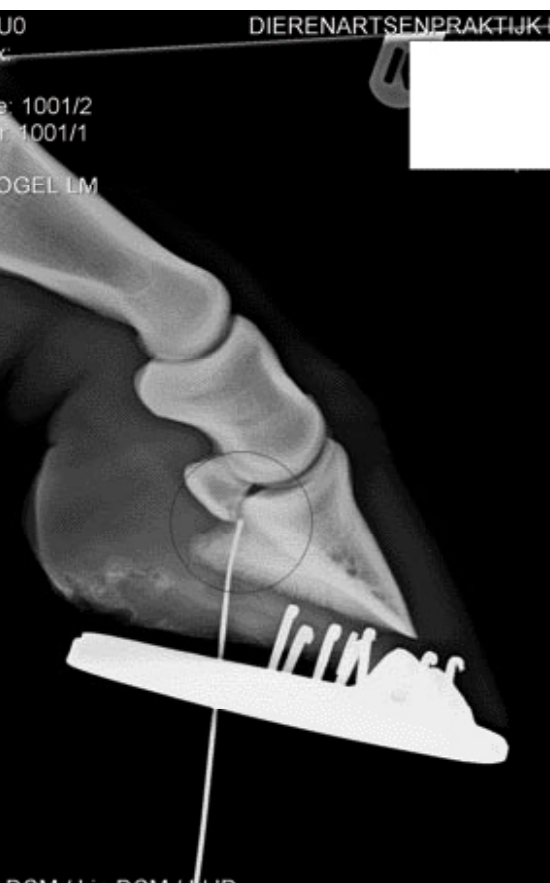
Bij nageltred is op een röntgenfoto met behulp van een steriele sondeernaald richting en diepte van het steekkanaal na te gaan.