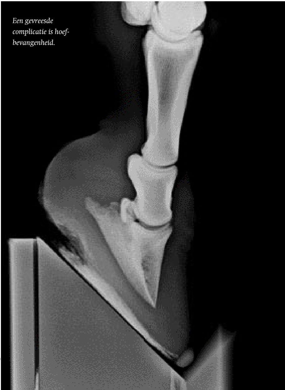
Een gevreesde complicatie is hoefbevangenheid.

Als er sprake is van artrose zien we dat het paard stijf en stram gaat lopen. De aandoening wordt veroorzaakt door veranderingen in en rond de gewrichten. Rond de gewrichten zijn in het meest typische geval botwoekeringen te zien. Het gewrichtskraakbeen